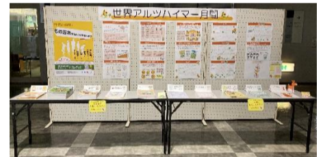
↑ 2021年度のパネル展示

※認知症に関するオレンジ通信(不定期発行)やオレンジガイドブックは、永山市民交流センターエントランスホールに置いてありますので、興味のある方はご自由にお持ち帰り下さい。